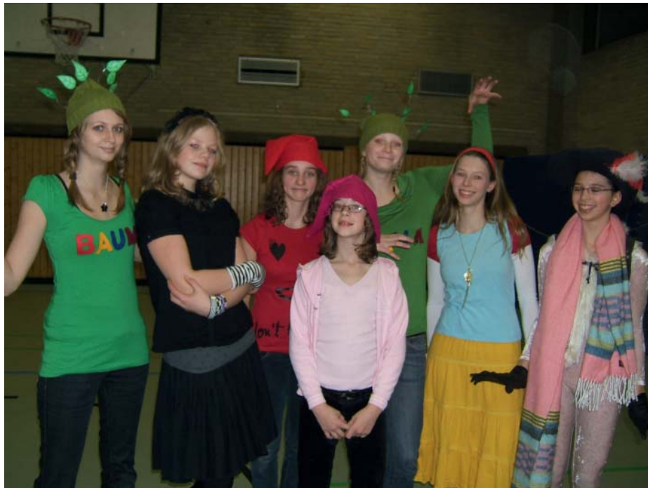
Schneewittchen, Stiefmutter, Jäger, Zwerge und Bäume